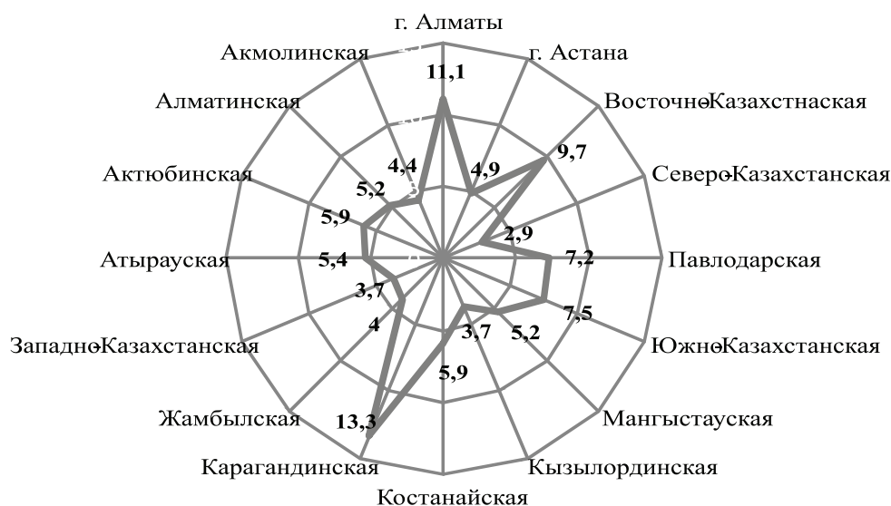
Рис. 2. Процентное соотношение работников, занятых во вредных или неблагоприятных условиях труда в региональном разрезе

На рис. 2. представлено процентное соотношение работников, занятых во вредных и других неблагоприятных условиях труда по областям.