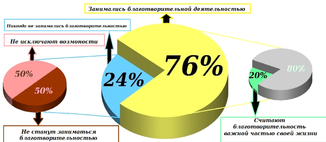
Рис. 1. Отношение к благотворительности в России